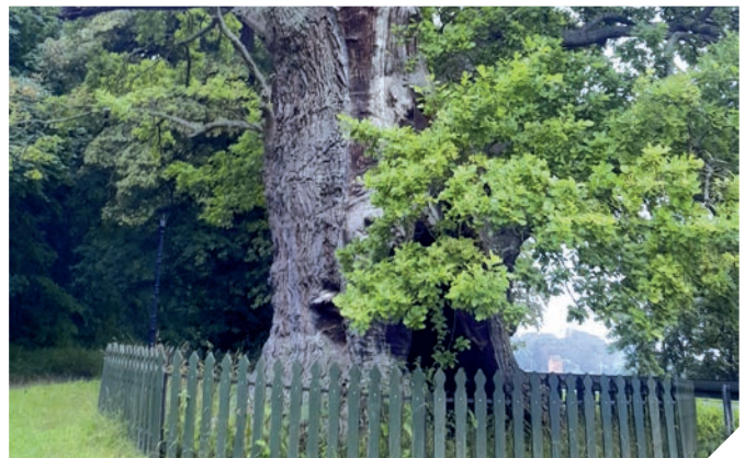
Eiche, derzeit Bażyński