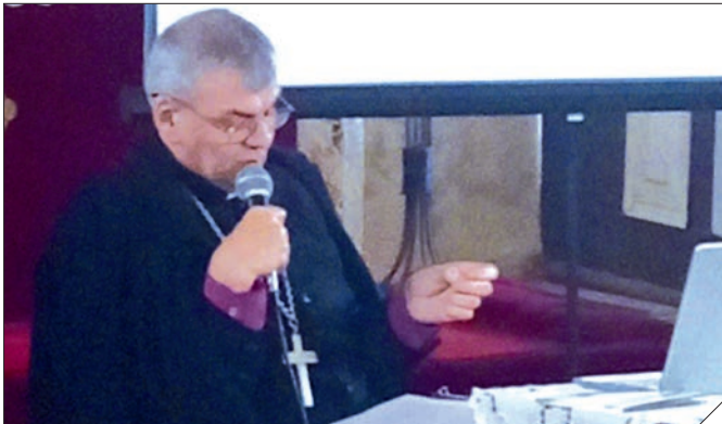
Vortrag in Sorquitten – Bischof Pawel Hause zu 500 Jahren Reformation

Vor 500 Jahren, am 8. April 1525, unterzeichneten der polnische König Sigismund I. und der Hochmeister des Deutschen Ordens Albrecht von Hohenzollern den Vertrag von Krakau. Es folgten die preußische Huldigung vom 10. April, die Gründung des Herzogtums in Preußen und die Reformation in Preußen. In diesem Jahr wird daher dieser Ereignisse und Wendepunkte der Geschichte gedacht.