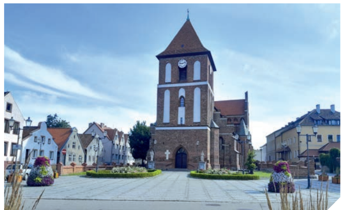
Kirchen von St. Jakobus der Apostel in Tolkemit