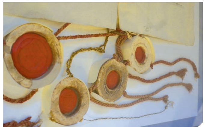
Die vier Siegel am Dokument, vorne das von Hochmeister Albrecht von Hohenzollern