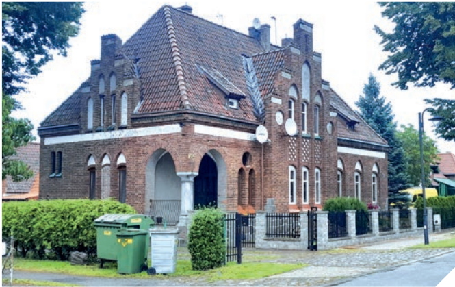
Ehemalige Schule in Cadinen