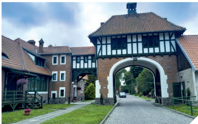
Tor zum kaiserlichen Hof

Tolkemit und Cadinen sind Touristenorte, die auf einer weiteren Skala noch unentdeckt und dadurch freundlich sind. Sie sind stark mit der Geschichte verbunden und verdienen entschieden einen Besuch.