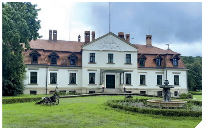
Kaiserlicher Sommerpalast in Cadinen

Die Blitzflut vom 29. Juli erinnerte alle an Tolkemit, einen kleinen Ort am Frischen Haff. Das kaum wahrnehmbare Flüsschen Stradanka schwoll infolge strömender Regenfälle gewaltig an, trat über die Ufer und überflutete den Teil der Stadt zur Seite des Haffs hin. Es verschonte nicht einmal die Feuerwehrremise. Aber es lohnt sich, an Tolkemit zu erinnern, denn das ist ein sehr guter Ort zur Erholung, nicht nur in den Ferien.