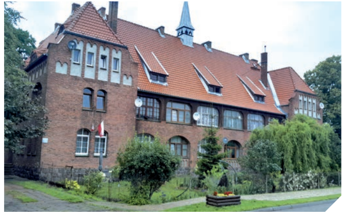
Ehemaliges Krankenhaus in Cadinen

für die Dorfbewohner bauen, die im Vorwerk, Krankenhaus, in der Schule und der Post arbeiteten. Und das alles ist in gutem Zustand bis heute erhalten. Ruhm verschaffte Cadinen noch die Kaiserliche Majolika-Manufaktur, die Europa eroberte. Mit der Zeit verwandelte sich die kleine Manufaktur in eine Ziegelei, in der Baukeramik produziert wurde. Leider gibt es sie nicht mehr. Aber im Vorwerk hat ein Kunsttöpfer eine Werkstatt, der seine Produkte verkauft und keramische Werkstätten für Kinder macht.