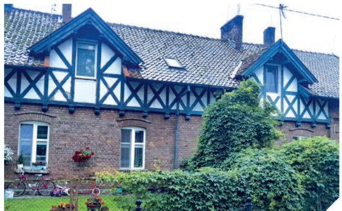
Eines der Häuser in Cadinen