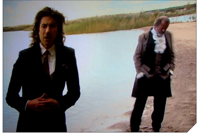
Szene aus dem Film