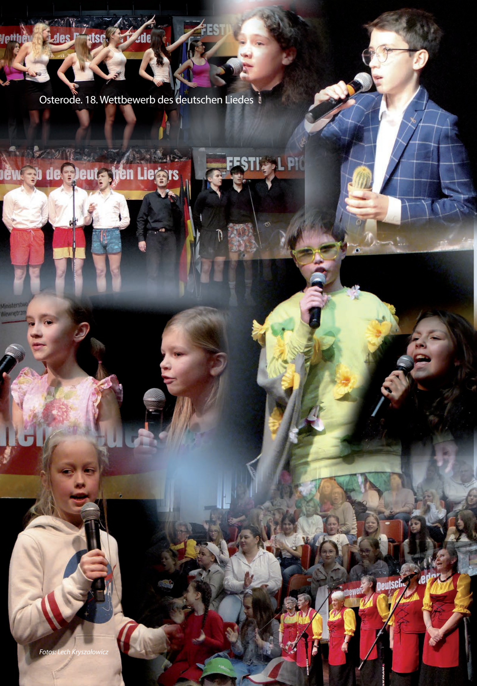
Osterode. 18. Wettbewerb des deutschen Liedes