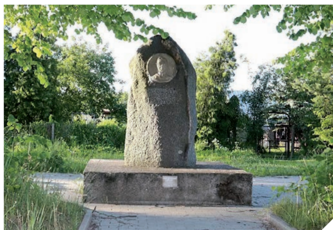
Dewischeit Denkmal in Lötzen

Im Jahr 1915 stifteten Lötzenser Fischer dem Dichter ein Denkmal in Lötzen für die Propagierung der nationalen und kulturellen Identität der Masuren. Fischer, die vom Fischen auf dem Mauersee zurückkehrten und am Denkmal vorbeikamen, zogen vor ihm die Mützen, da sie es als Symbol der Erinnerung an jene behandelten, die nicht vom Fischfang zurückgekommen waren. Das Denkmal Dewischeits wurde durch die Stadt Lötzen im Jahr 1987 grundlegend renoviert und befindet sich seit dieser Zeit unter der Obhut der Selbstverwaltung.