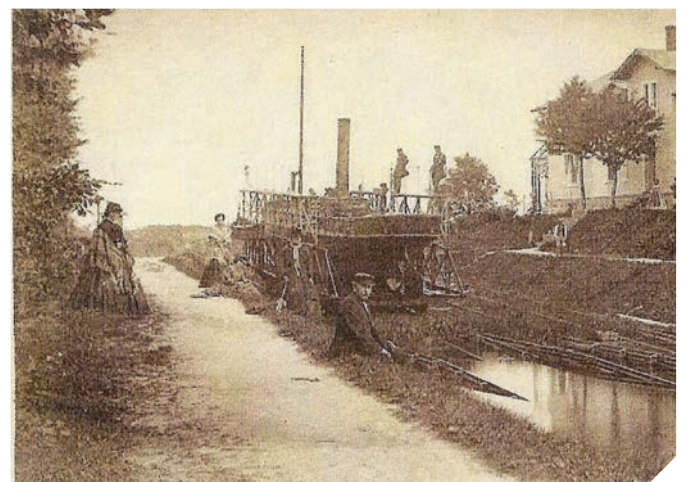
Das von Ryszard Kowalski gefundene Bild