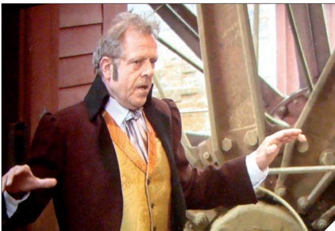
Szene aus dem Film

Das Ganze dauert etwa 60 Minuten. Die Realisierung des Films unterstützte der von der Selbstverwaltung der Woiwodschaft gegründete Ermlandisch-Masurische Filmfonds finanziell.