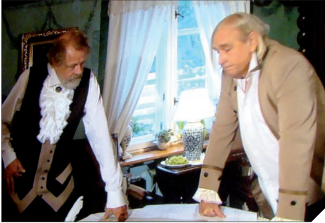
Szene aus dem Film

Auch der Darsteller der Hauptrolle wusste vor dem Film nicht viel über sein Vorbild.