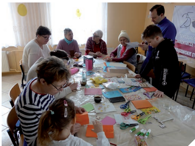
Eifriges Arbeiten im Saal der Sensburger Bärentatze

Außerdem lernen sich auf diese Weise die verschiedenen Generationen in der deutschen Minderheit kennen, da auch – eine interessante Nebenwirkung der Samstagskurse – die Eltern aus der mittleren Generation ihre Kinder abholen und oft noch ein wenig bleiben.