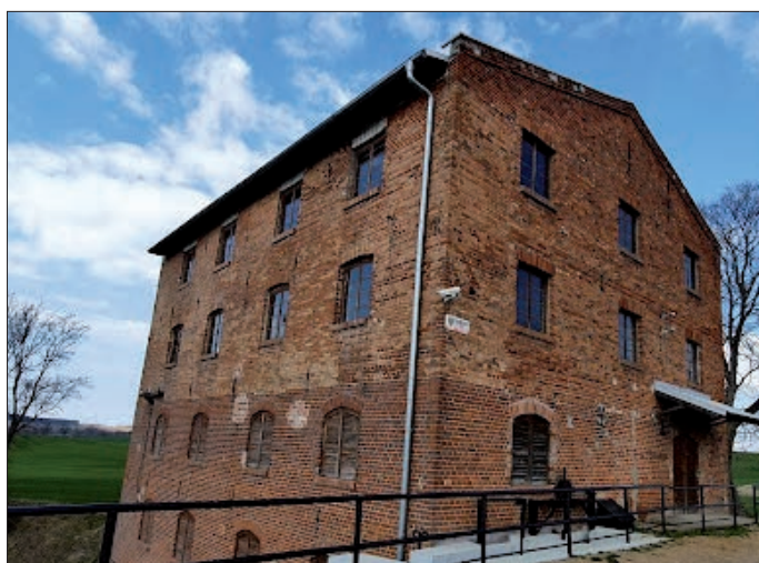
Ganswindts Mühle in Voigtshof