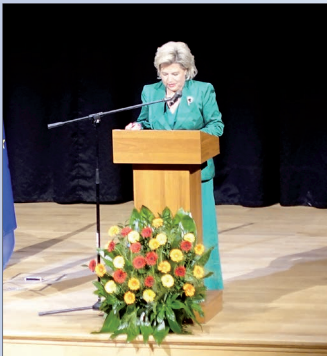
Generalkonsulin Cornelia Pieper bei ihrer Ansprache