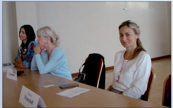
Vertreterinnen der deutschen Gesellschaften in Neidenburg und Elbing