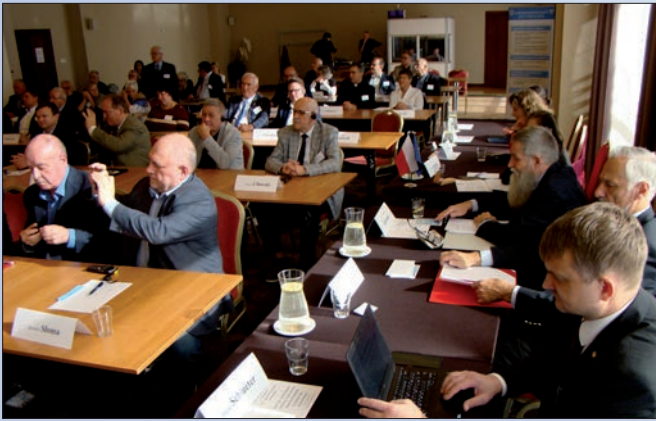
Teilnehmer des Kongresses