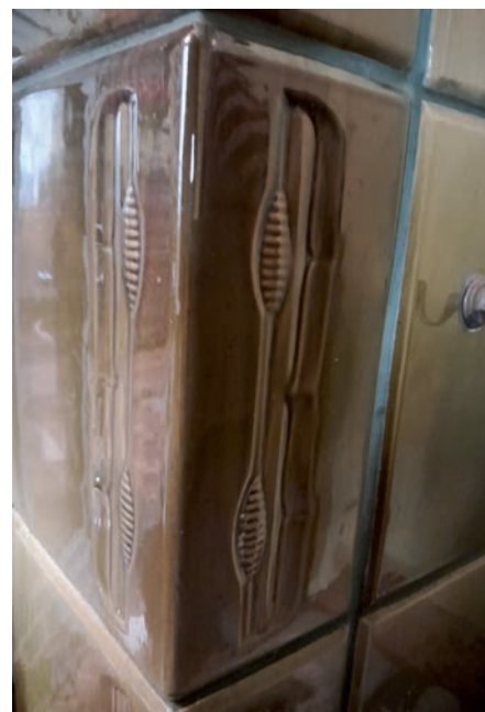
Kafel piecowy z Prus Górnych Ofenkachel aus dem Oberland

Die wichtigsten Töpferwerkstätten Ostpreußens lagen am Rande des Weichseltales, südlich des Frischen Haffs, im Oberland und im westlichen Masuren. Man schuf nicht nur Geschirr und Vasen, sondern auch Plastiken und Ofenkacheln. Töpfereien gab es in fast allen Ortschaften des Oberlandes, zum Beispiel in Mühlhausen oder Preußisch Holland. Eine für das Oberland charakteristische Gefäßform war der Paartopf mit Tragegriff, mit dem man Essen brachte.