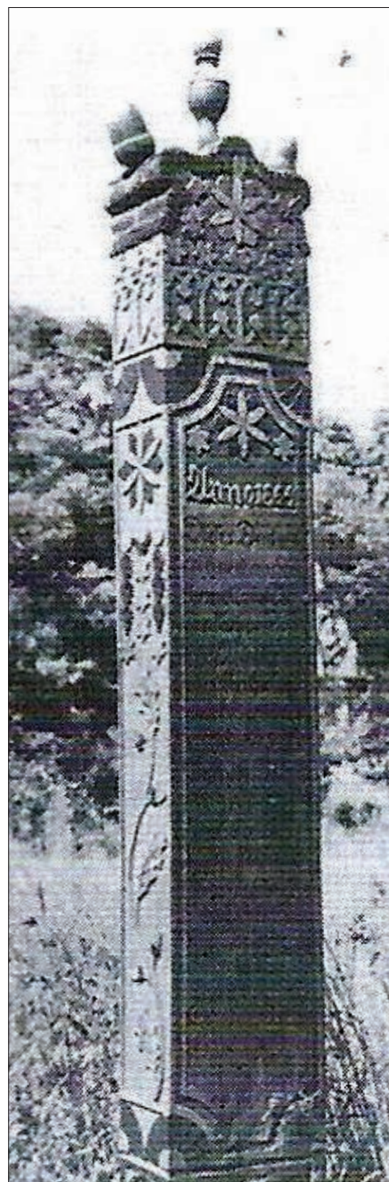
Górnopruska stela nagrobna z 1864 roku z Kalnika w powiecie morąskim, w dawnym muzeum Ojczyźnianym w Królewcu