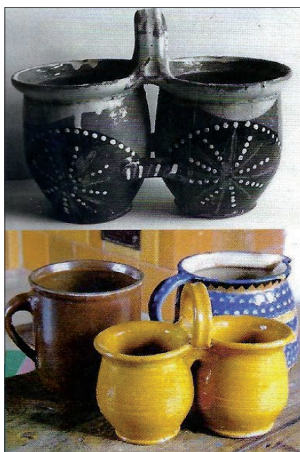
Dwojaki z Prus Górnych Paartöpfe aus dem Oberland

Najważniejsze zakłady ceramiczne Prus Wschodnich leżały na skraju doliny Wisły, na południu od Zalewu Wiślanego, w Prusach Górnych i w zachodniej części Mazur. Tworzono nie tylko naczynia i wazy, ale też figurki, rzeźby i kafle piecowe. Warsztaty ceramiczne istniały prawie we wszystkich miejscach Górnych Prus, np. w Młynarach, Pruskiej Holandii (Pasłęku). Charakterystycznym naczyniem dla Prus Górnych były dwojaki z uchwytem, w których przenoszono jedzenie.