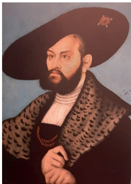
Książę Albrecht von Hohenzollern (1525-68) Herzog Albrecht von Hohenzollern (1525-68)