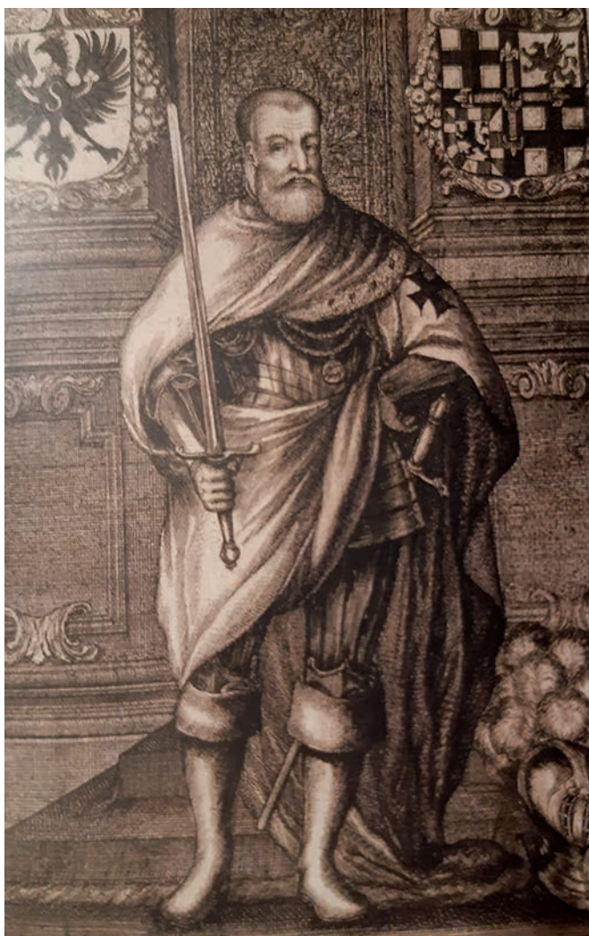
Ostatni Wielki Mistrz Zakonu Niemieckiego w Prusach Albrecht von Brandenburg-Ansbach (1511-25)

Preußen wurde 1525 in drei sog. Kreise eingeteilt: in den samländischen, nangischen und oberländischen Kreis. Der Oberländische Kreis entstand aus drei oberländischen Komtureien des Deutschen Ordens (Elbing - Pr. Holland, Christburg und Osterode) und dem Gebiet des Bistums Pomesanien. Dem Kreis wurden die zwölf Hauptämter Pr. Holland, Mohrunen, Liebstadt, Liebmühl, Osterode, Hohenstein, Pr. Mark, Marienwerder, Riesenburg, Neidenburg, Soldau und Ortelsburg (mit den Ämtern Willenberg und Passenheim) sowie drei Erbämter (Rosenberg, Dt. Eylau und Gilgenburg) zugeordnet. Zur Hauptstadt des Oberländischen Kreises und zum Sitz der damaligen Kreisbehörden wurde die zentral liegende Stadt Saalfeld ernannt und blieb es bis 1752; dann wurde der Oberländische Kreis aufgelöst.