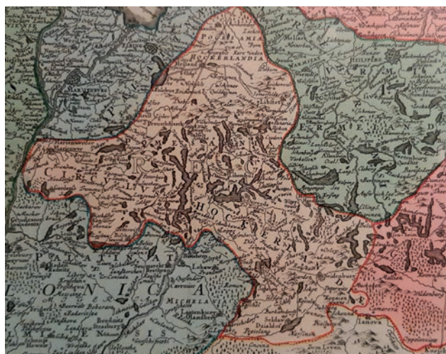
Okręg Górnopruski (Circulus Hockerlandiae) na mapie Prus Wschodnich J. B. Homanna z 1710 r.

Stolicą Okręgu Górnopruskiego i siedzibą ówczesnych władz okręgowych zostało centralnie położone miasto Zalewo (Zalewo) i pozostawało nią do 1752 r. Wtedy Okręg Górnopruski został zlikwidowany.