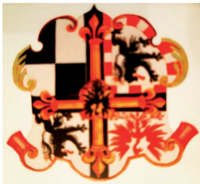
Herb Wielkiego Mistrza Albrechta von Brandenburg-Ansbach Wappen des Hochmeisters Albrecht von Brandenburg-Ansbach

Der letzte Hochmeister des Deutschen Ordens in Preußen Albrecht von Brandenburg-Ansbach (1511-25)