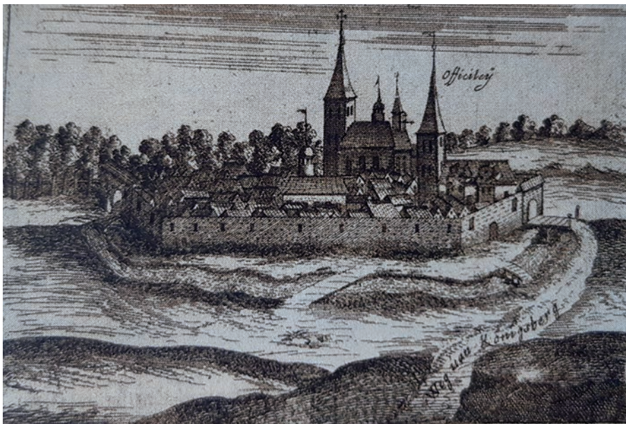
Zalewo ok. 1550 r. z Chr. Hartknoch, Alt- und Neues Preußen, Frankfurt, Lipsk 1684