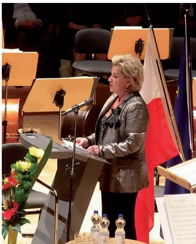
Cornelia Pieper, Generalkonsulin