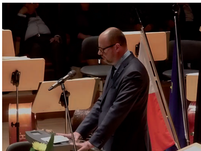
Paweł Adamowicz, der Stadtpräsident von Danzig