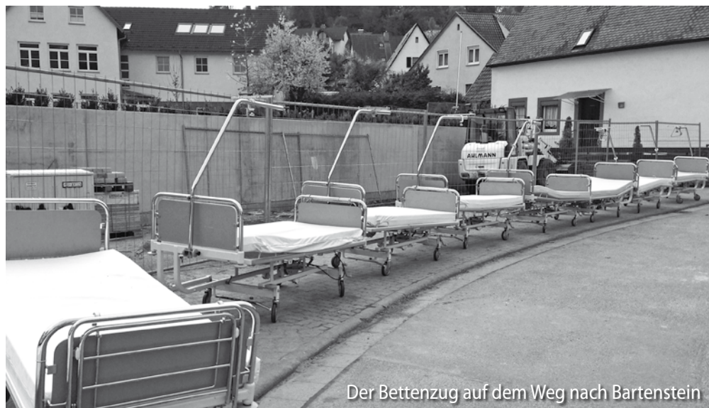
Der Bettenzug auf dem Weg nach Bartenstein